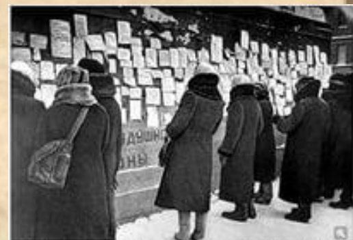
8 дня блокады Ленинграда. Объявление об обмене вещей на продукты. 1942