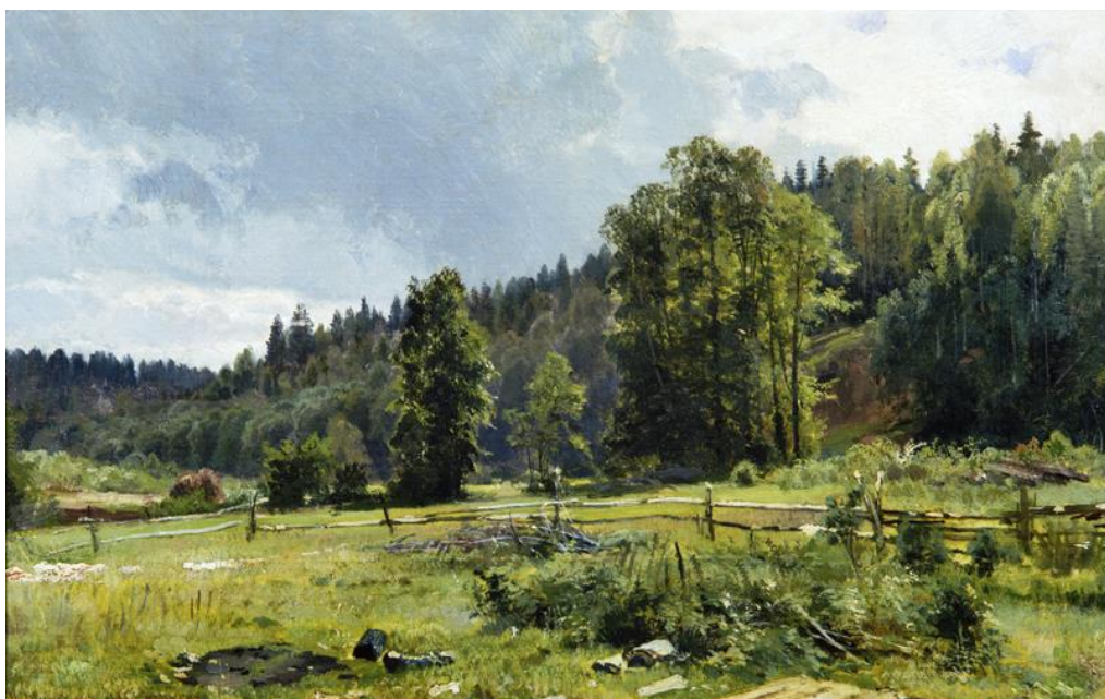
Шишкин И.И. Луг на опушке леса. Сиверская

Сиверская - это место, которое можно по праву назвать одним из самых богатых на красоты. Потому что количество мест с красивыми пейзажами здесь не поддается исчислению. И пейзажи на любой вкус: равнины и долины, обрывы, горки, сосновые леса, лиственные рощи, родники, причудливые речные изгибы...А что самое главное - эти места красивы в любое время года!