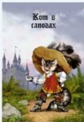
Кот в сапогах