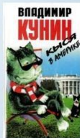
Кыся в Америке