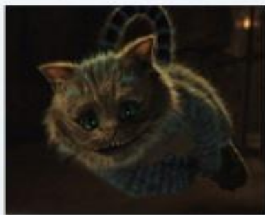
Чеширский кот. Алиса в стране чудес