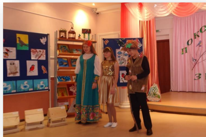
«Покормите птиц зимой»

Проведено более 10 мероприятий экологической направленности.