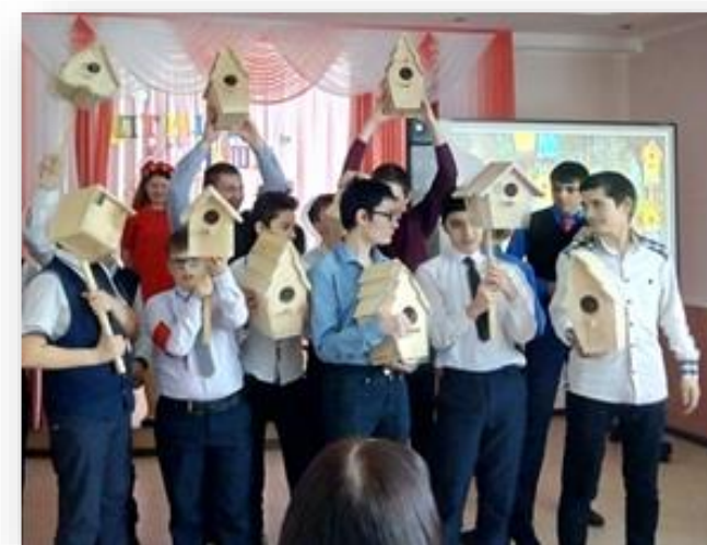
«Птицы наши друзья»