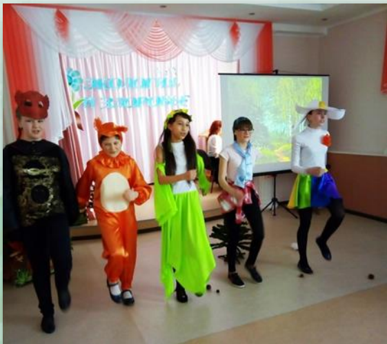
«Экология и здоровье»