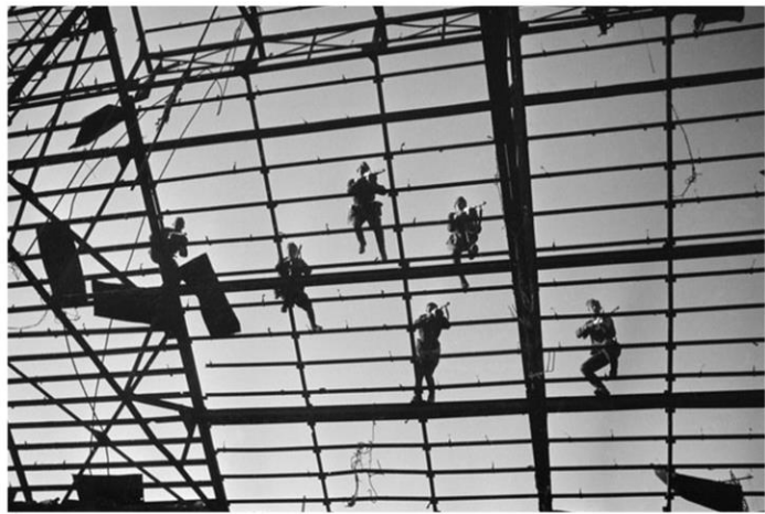
Бои на обрешетке стеклянной крыши заводского сборочного цеха.