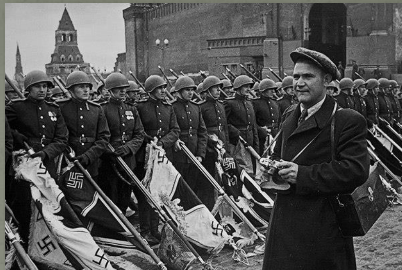
Москва, Парад Победы. Евгений Халдей на съемке 24 июня 1945 года

Кадры Евгения Халдея 1941 – 1946 годов, запечатлевшие войну от объявления о нападении Германии на СССР до Нюрнбергского процесса, обошли весь мир и приведены в качестве иллюстраций в бесчисленных учебниках, документальных книгах и энциклопедиях.