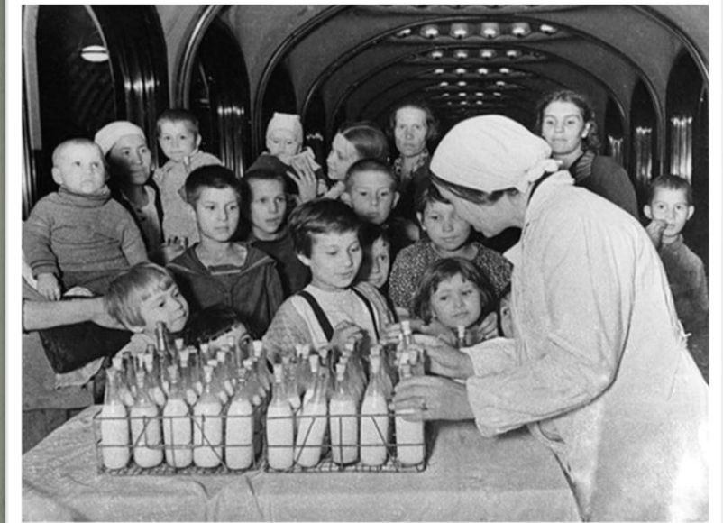
Сталинград, осень 1942.