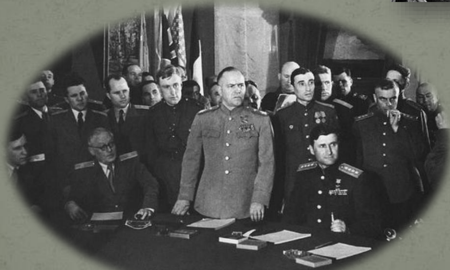
Маршал Г.К.Жуков во время подписания Акта о безоговорочной капитуляции