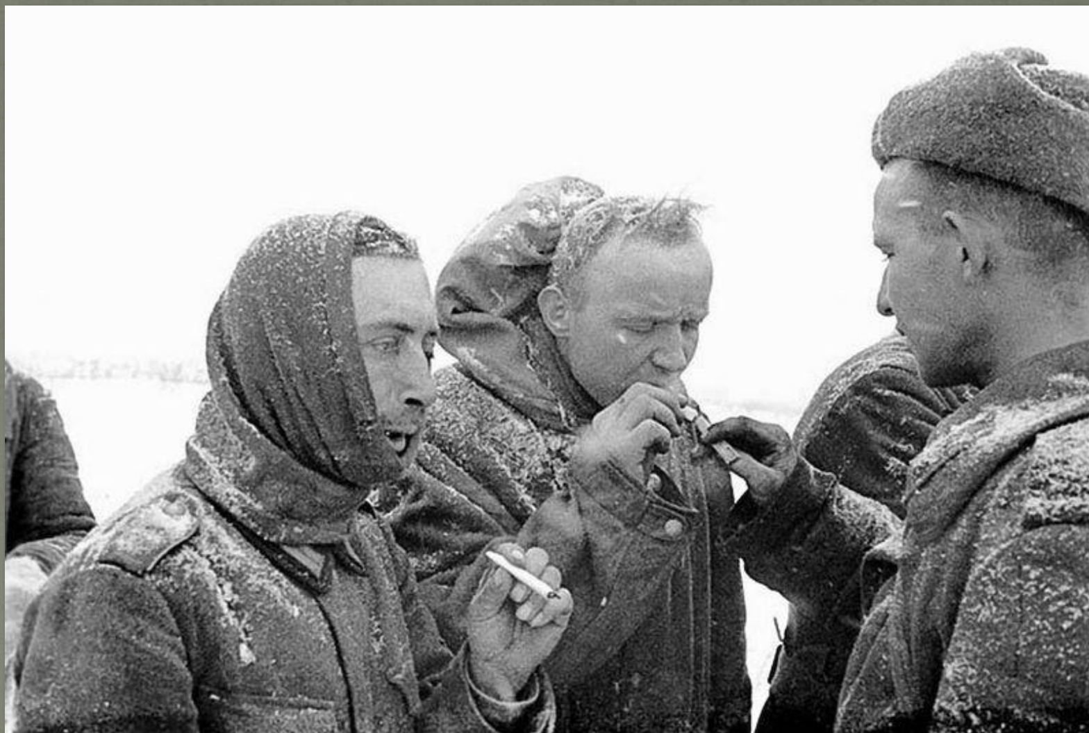
Советский боец дает прикурить пленным немцам