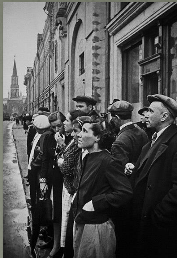
Москвичи слушают выступление В.Молотова о нападении Германии на Советский Союз.