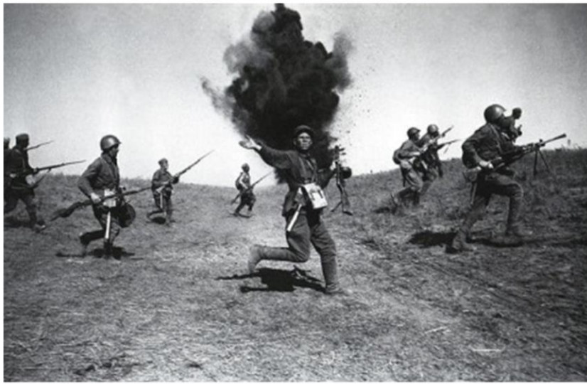
Политрук. Сталинград. 1942