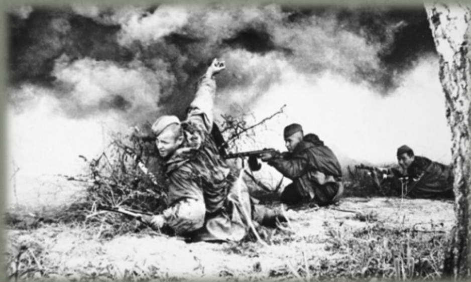
Аркадий Шайхет (1898—1959)