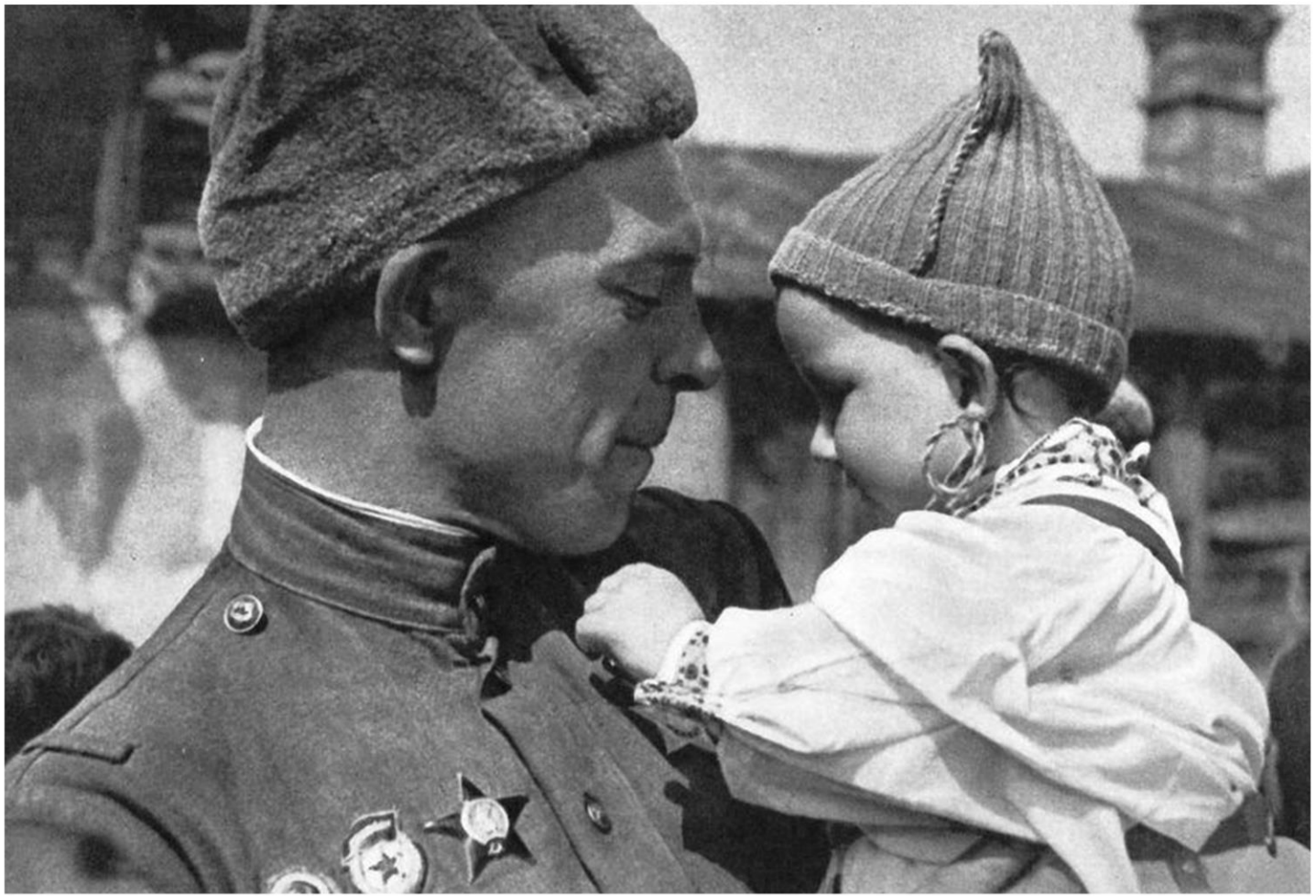
Советский солдат с чешским ребенком на руках