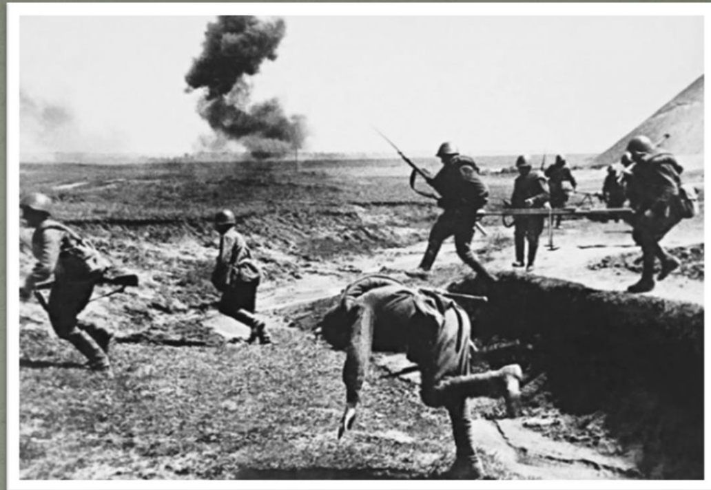
Гибель советского солдата во время атаки