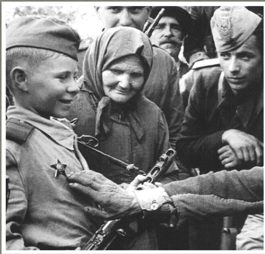
Награждение молодого героя