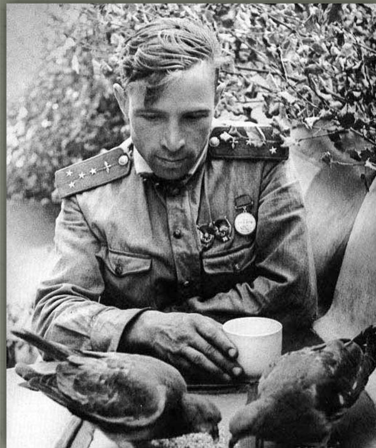
Советский летчик кормит голубей в минуты отдыха