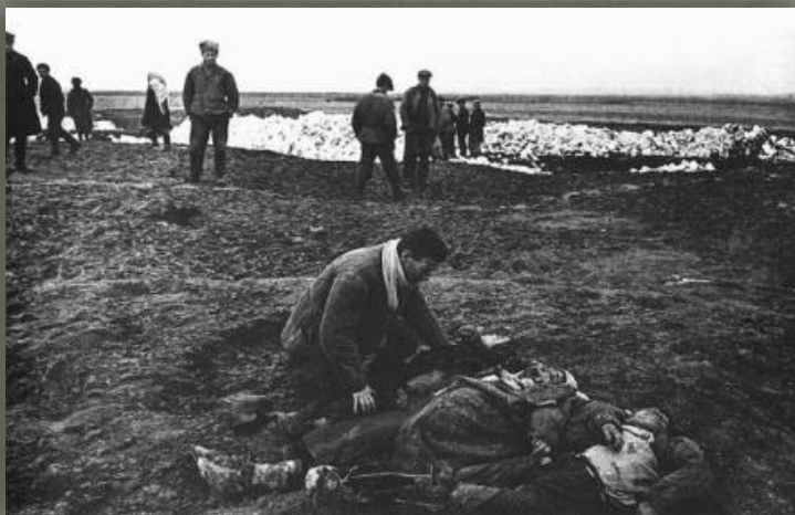
Нашел своих родных. Крым 1942