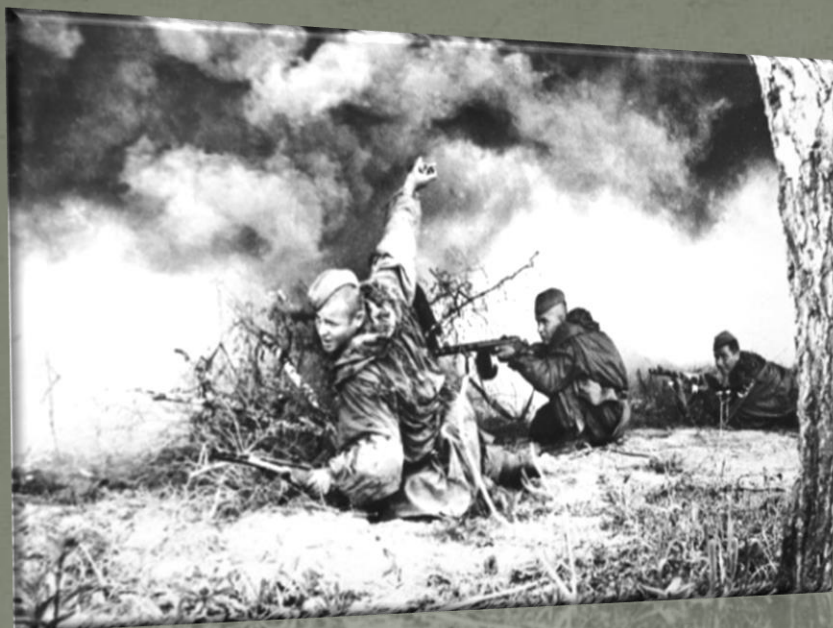
Советские разведчики в бою