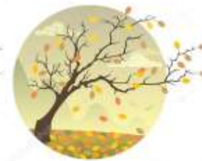
СИМВОЛЫ ВРЕМЕН ГОДА