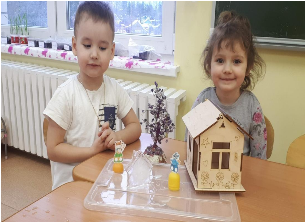
Экспериментирование «Избушки лубяная и ледяная»