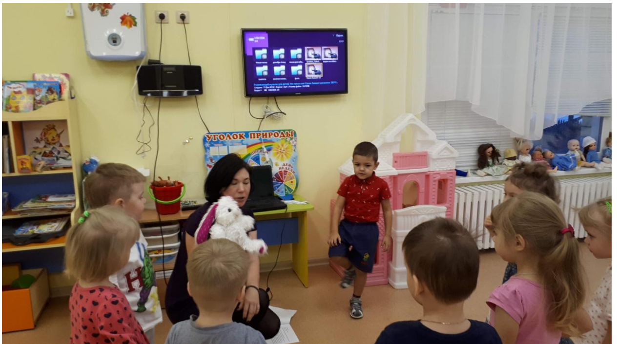
Подвижная игра «Зайка беленький сидит»