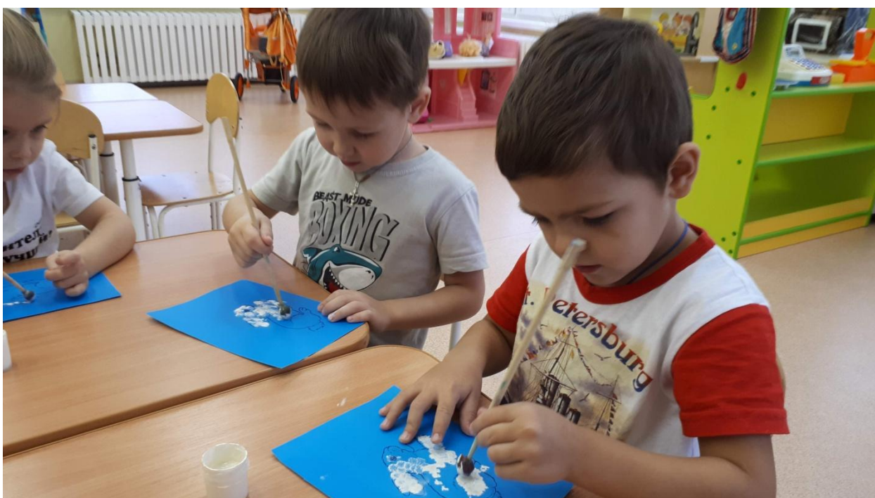
Рисование «Зайчик беленький сидит»