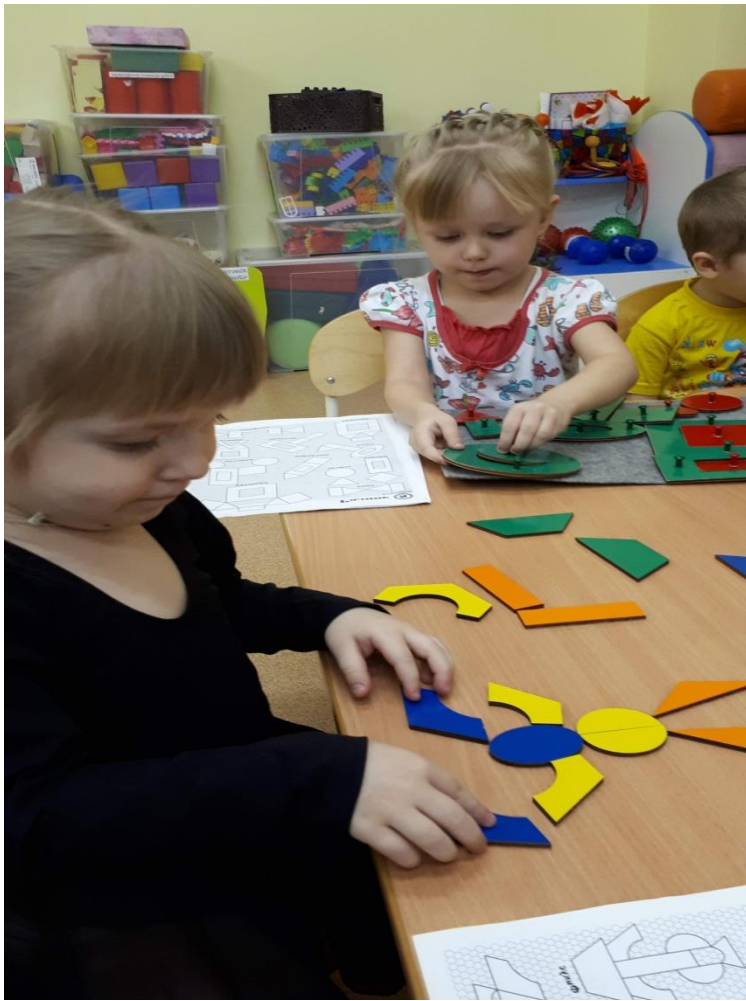
Конструирование «Зайчик с использованием плоскостного конструктора «Чудо-соты»