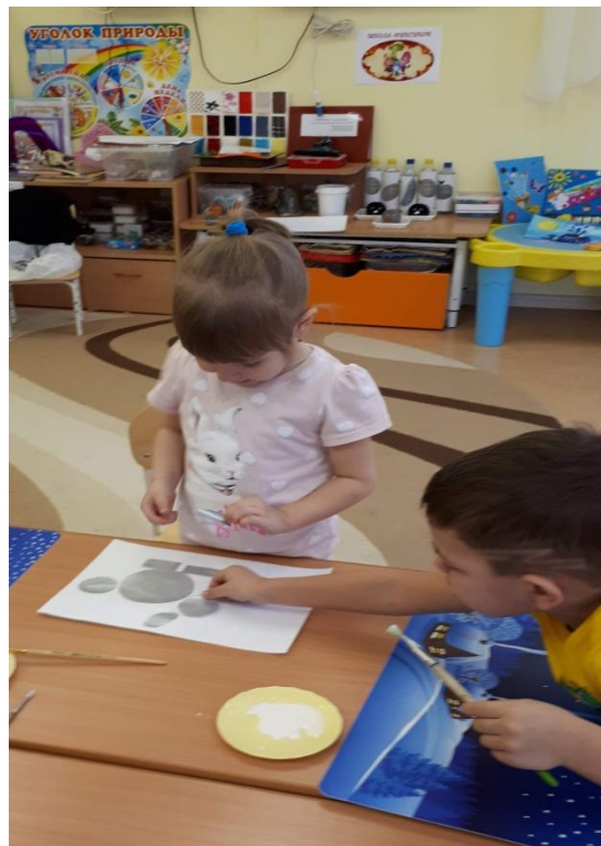
Аппликация из геометрических фигур « Лиса и заяц»