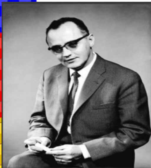
Ол Кирк Кристиансен

История создания конструктора номер один началась в 1932 году в Дании, Ол Кирк Кристиансен, в то время бригадир плотников и столяр, начинает свое дело и занимается производством лестниц, гладильных досок и деревянных игрушек. Спустя 17 лет, в 1949, был создан первый пластмассовый кубик ЛЕГО.