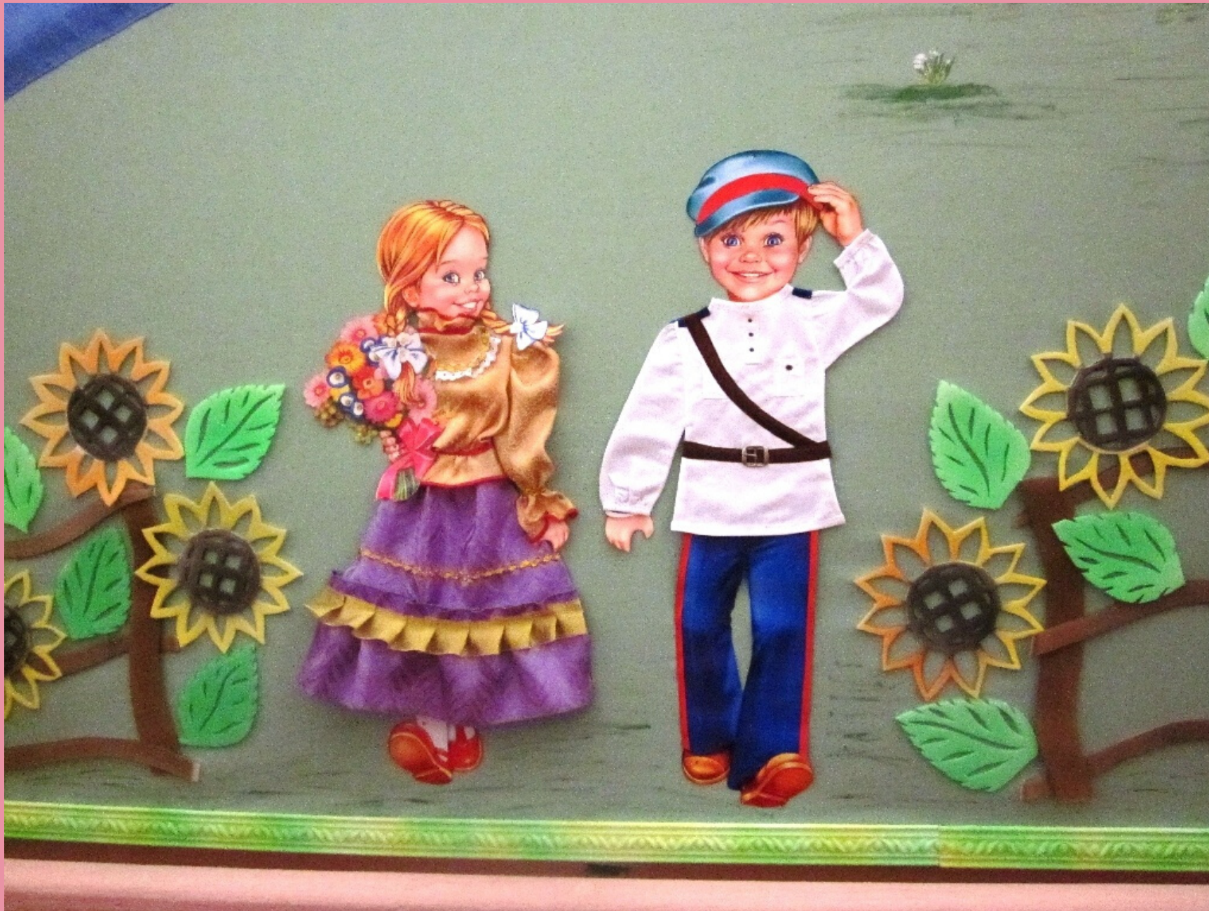
КОМАНДА "ДОНСКИЕ КАЗАЧАТА"